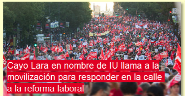
Cayo Lara en nombre de IU llama a la movilización para responder en la calle a la reforma laboral

No hay que tirar la toalla y no se admite la resignación. Hay que redoblar los esfuerzos en la movilización social para cambiar este estado de pasar a la ofensiva que frene la marea neoliberal que pretende arrasar con todos nosotros y nosotras, y hay que apoyar cualquier movilización que se convoque de forma inmediata contra una reforma que pretende la destrucción de la clase obrera.